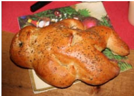
Es stimmt: Figugegl

alle ihre Plätze eingenommen, klopfte es vernehmlich an der Türe. Natürlich der Samichlaus! Er wurde begleitet von 2 (!! ) Schmutzli. Er stellte sich und seine Begleiter kurz vor und schlug dann das geheimnisvolle Buch auf. Leider waren nur wenige Kinder anwesend, schade. Diese allerdings waren,