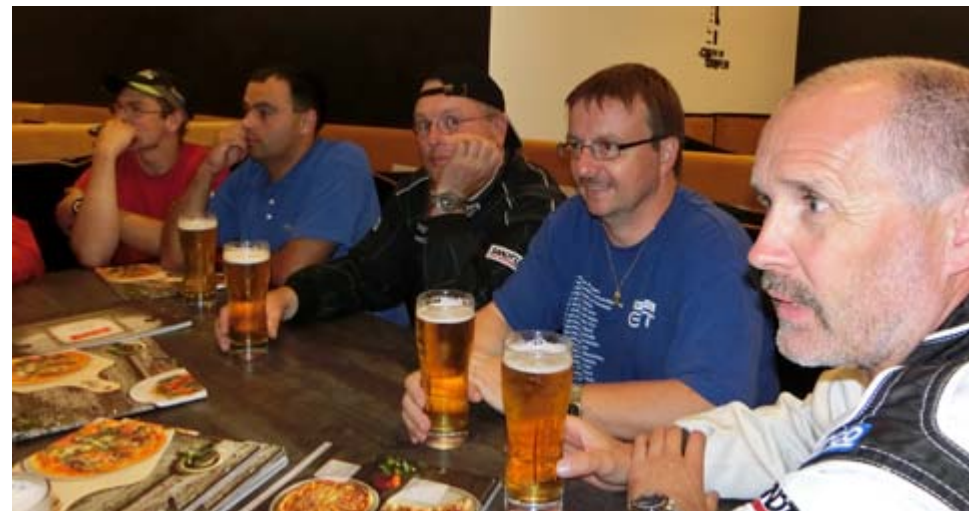
Das haben wir uns verdient....

Die Rallye dauerte drei Tage, ca. 1000 km und umfasste 20 Prüfungen. Diese verlangten dem Auto- und Bei-