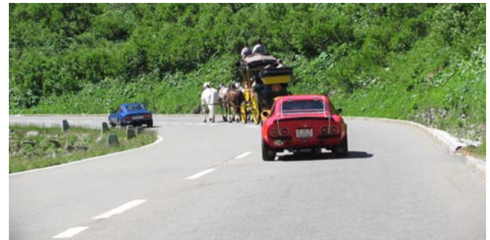
Mit 4 Pferdestärken unterwegs wie vor 100 Jahren

Die Strassen waren eng und es hatte bis Cannobio sehr viel Verkehr. Danach wurde es ruhiger und die Fahrt um die engen Kurven und den Felsen entlang dem See, war wunderschön. In Verbania angekommen mussten wir nur kurz auf die Autofähre warten, welche uns ans andere Seeufer bringen sollte.