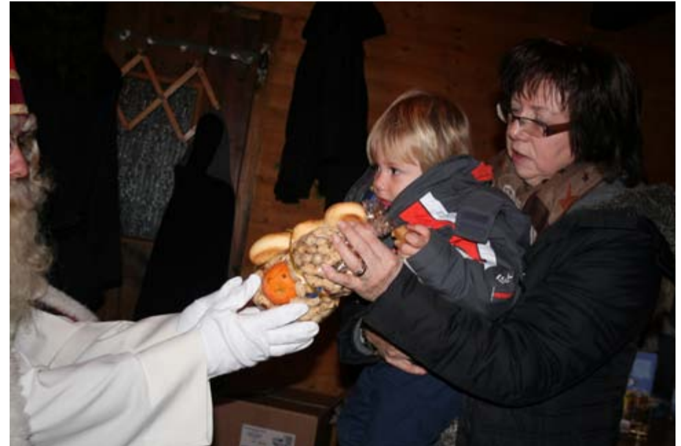
Überwältigt vom Nicolaius..

Bei uns ging es indessen mit dem Fondue los. Die Fonduemischung wurde in die Caquelons gestürzt. Wir rührten und rührten, mal eine 8 auch mal eine 9 und trotzdem wollte der Käse nicht so richtig flüssig werden ....und wenn, dann nur teilweise. Also musste jede Pfanne auf dem angeheizten Holzherd mit grösserer Hitze bearbeitet werden. Und siehe da, es klappte. Das cremige Fondue mundete sehr, zumal wir Spezialbrot in Form eines mit Ros-