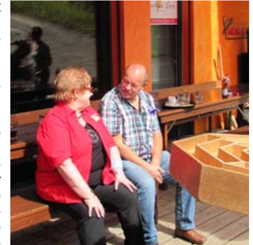
Auf dem Bänklein auf ein Schwätzchen ☺ ☺

schön schwierig, einen Nagel mit einem Hammer, der ein Loch hat, einzuschlagen. Bei der Labyrinth-Kugel war T. E. A. M. Work (Toll ein anderer macht's) angesagt. Frei nach dem Motto: dein Tischnachbar hat schon wieder zuviel oder zu wenig am Labyrinthisch gerüttelt. Oder gegenseitig wirkende Kräfte heben sich auf. Beim Bogen- und Armbrustschiesen war dann wiederum jeder ein Einzelkämpfer oder Heckenschütze, der in die Mitte des Apfels treffen musste, um damit möglichst viele Punkte für die Gruppe einzuheimsen. Beim entfernen der Pfeile von der Zielscheibe wurde einem bewusst, dass Bogen und Armbrust eine beachtliche Durchschlagskraft entwickeln. Alles in allem war es eine gelungene und spassige Sache. Nach Abschluss der Spiele standen ein Salatbuffet und der Grill bereit, um abge (--scho-->) ge_ssen zu werden.