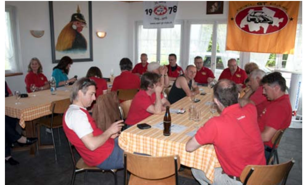
GV Treffen 26. April 2014

Ich bin immer noch stolz, diesen Club zu leiten und habe nach wie vor auch noch viel Spass daran. Dank Euch!! Zum vergangenen Vereinsjahr möchte ich noch etwas in den Erinnerungen von 2013 schwelgen.