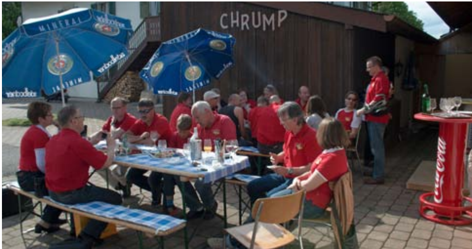
So ein Tag der dürft nie vergehn