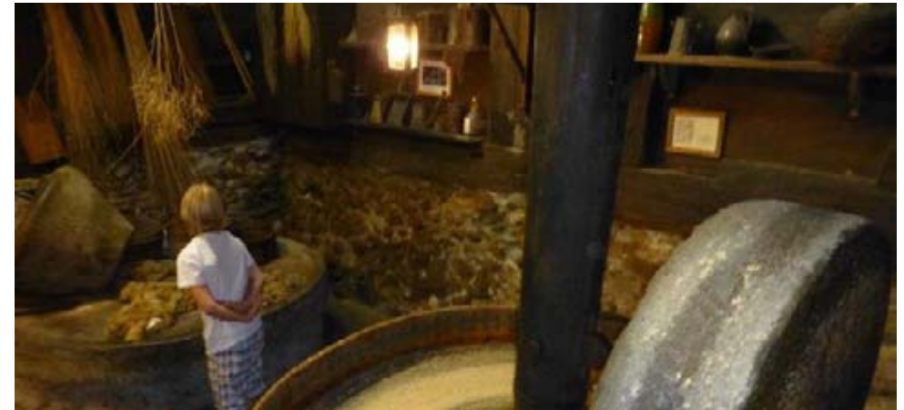
Mühle der alten Art

Römerstrasse 7 Postfach 351 4601 Olten Telefon: 062 296 54 50 Fax: 062 296 54 23 Öffnungszeiten: Montag und Mittwoch 13:30 - 17:00 Uhr