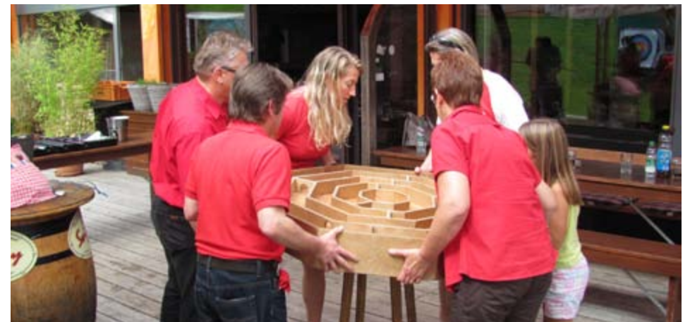
Das tückische Labyrinth

Wir fuhren bei schönstem Wetter ganz brav auf Landstrassen nach Sörenberg ins Lokal Go-In. Dort angekommen, bestellten wir erst mal eine Runde Kaffee, Eistee, Wasser oder Bier. Kaum hatten wir uns hingesetzt und bestellt, konnte es dem Eventmanager nicht schnell genug gehen, um uns ins Plauschturnier einzuführen. Stress bei Seite. Wir durften mit Armbrust, Pfeilbogen, Hammer mit Loch, Murrel und