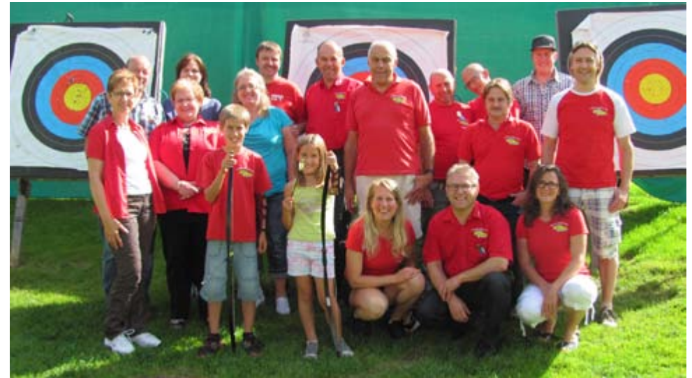
Der Club der Spieler mit Pfeil und Bogen

Telefon: 044 310 12 82 Mail: postmaster@supratrade.ch