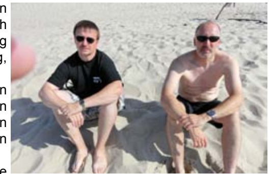
Zwei am fernen Strand