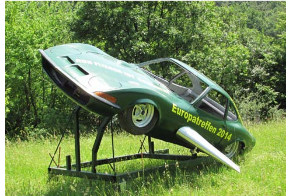
IG Bergstrasse 7. - 9. Juni 2014

Es war ein wunderschönes Europa-Treffen „SUPER ORGANISIERT“ und das Wetter war für viele zu Warm! Im GT bis zu 50 Grad!!!!