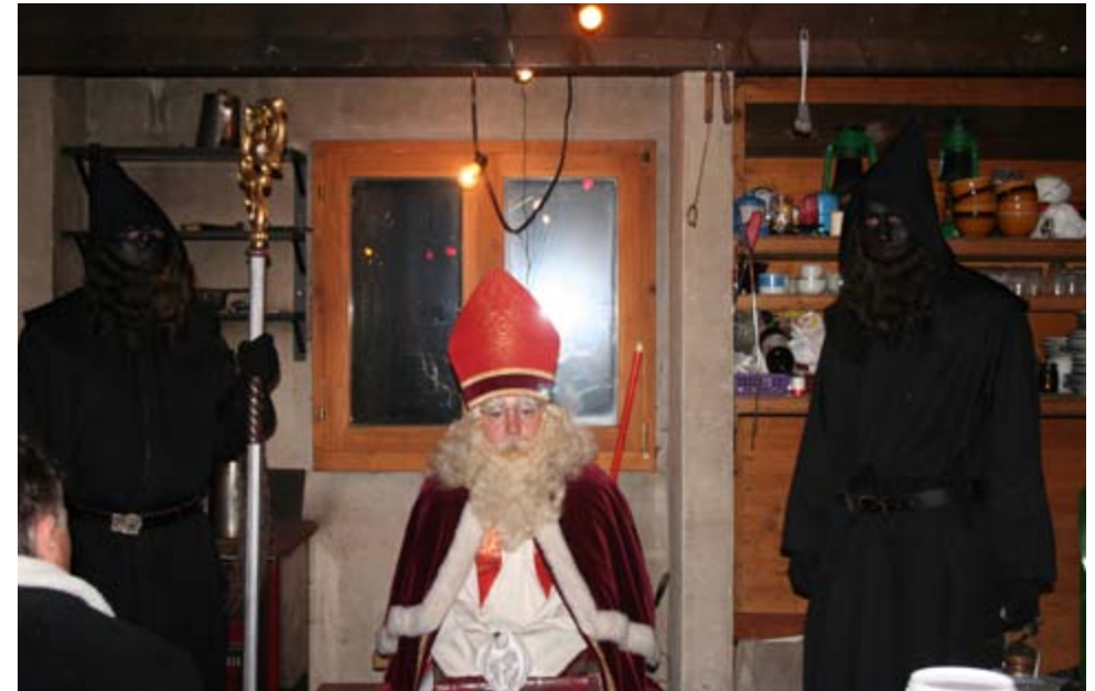
Samichlaus und die 2 schwarzen Pitten (Schmutzli) 29. November 2014