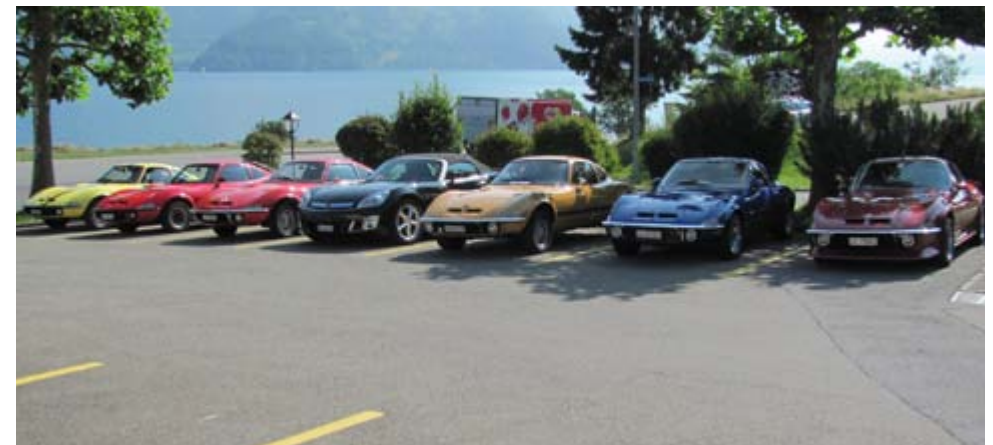
Klein und kompakt, mit und ohne Klimaanlage ins Tessin 21./22Juni 2014