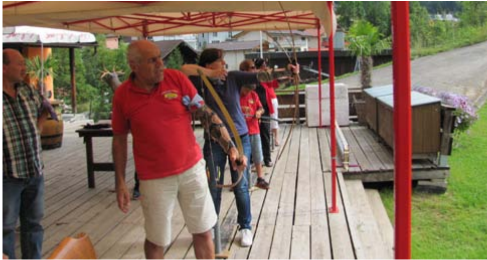
Na, ob der Pfeil wohl ins Schwarze traf?

Blasrohr „bewaffnet“ den Spuren des Schweizer Nationalhelden Willy folgen.