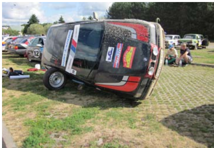
Getriebewechsel auf litauisch

Krönung gab es noch einen Strohhalm ins Glas. Nun ja, das Gelächter war gross... Wir fuhren anschliessend wieder zu unserem Hotel nach Litauen (Klaipėda) zurück. Ich war von der Fahrt (und nicht vom leckeren Eistee!) so müde, dass ich direkt ins Bett fiel. Die anderen nahmen noch einen Schlummertrunk an der Hotelbar. Mittwochmorgen fuhren wir ausgeschlafen auf eine Insel, welche 95 km lang ist und gingen verschiedene