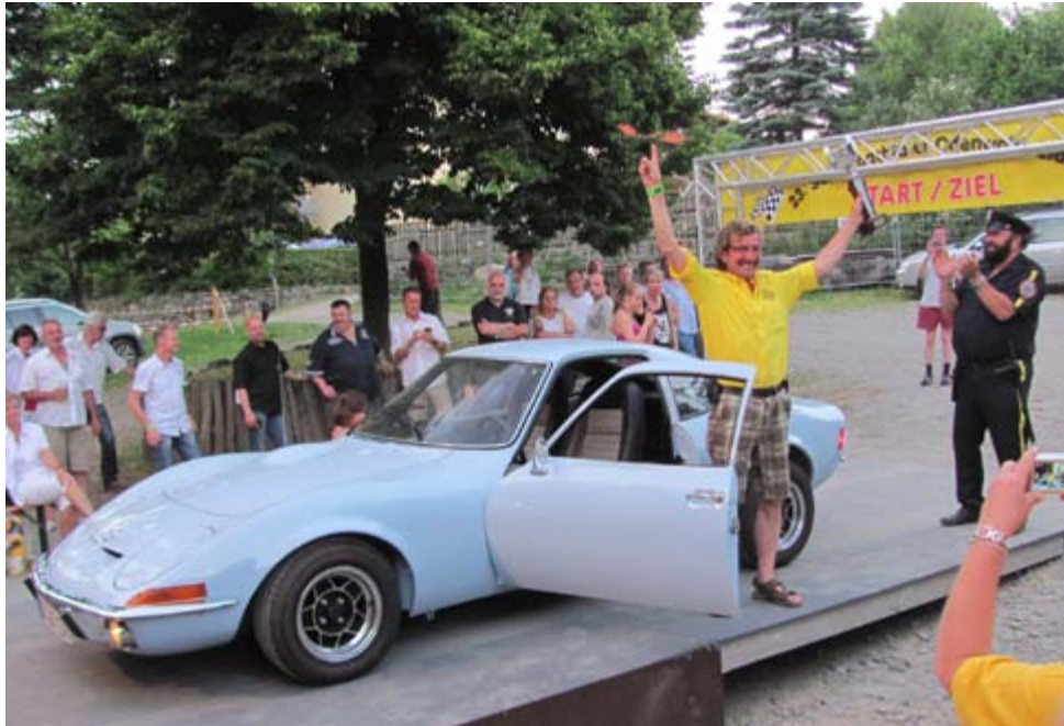
Ein stolzer Sieger

Nach der Abkühlung, am Abend, fuhren wir wieder mit unserem Schuttlbus zur Abendunterhaltung wo die „Post“ abging bis um Mitternacht. Ach jaaaa da war doch noch etwas an dem Abend, da war ein Doppelgänger von Bud Spencer, unsere Frauen waren komplett aus dem Häuschen und wollten alle ein Foto von der „Berühmtheit“, als Gegenleistung wollte er von allen ein Küsschen auf die Wange.