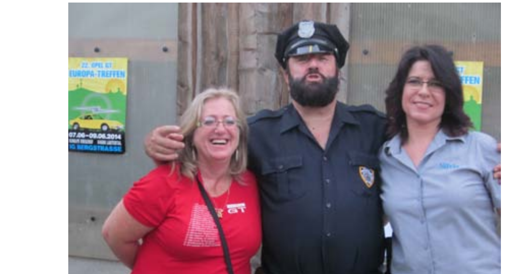
Buddy mal ganz nah