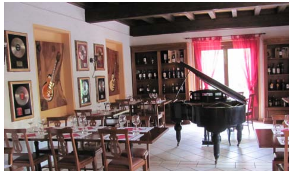
Auf den Spuren der Rockband Gotthard