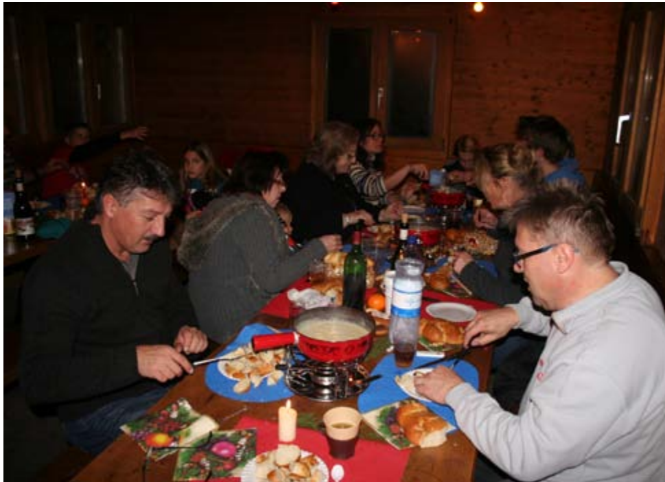
Es bitzeli Chäs und es Stück Brot

alle ihre Plätze eingenommen, klopfte es vernehmlich an der Türe. Natürlich der Samichlaus! Er wurde begleitet von 2 (!! ) Schmutzli. Er stellte sich und seine Begleiter kurz vor und schlug dann das geheimnisvolle Buch auf. Leider waren nur wenige Kinder anwesend, schade. Diese allerdings waren,