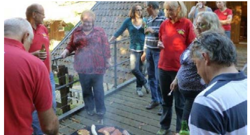
Es liegt was in der Luft