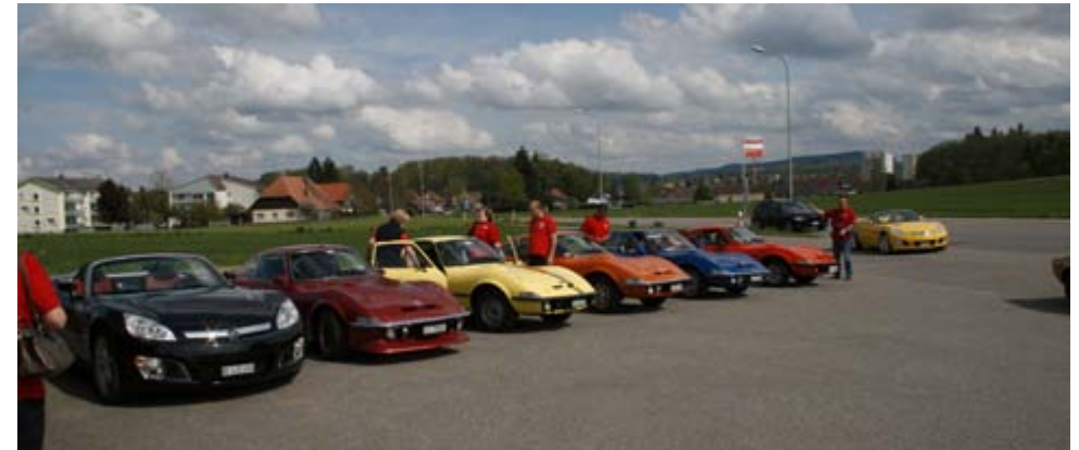
GV Treffen 26. April 2014