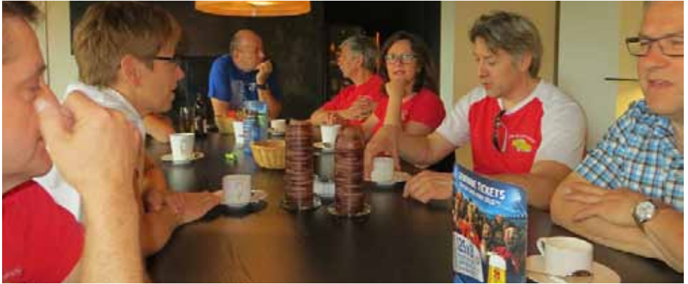
Nach dem Kaffe gehts weiter