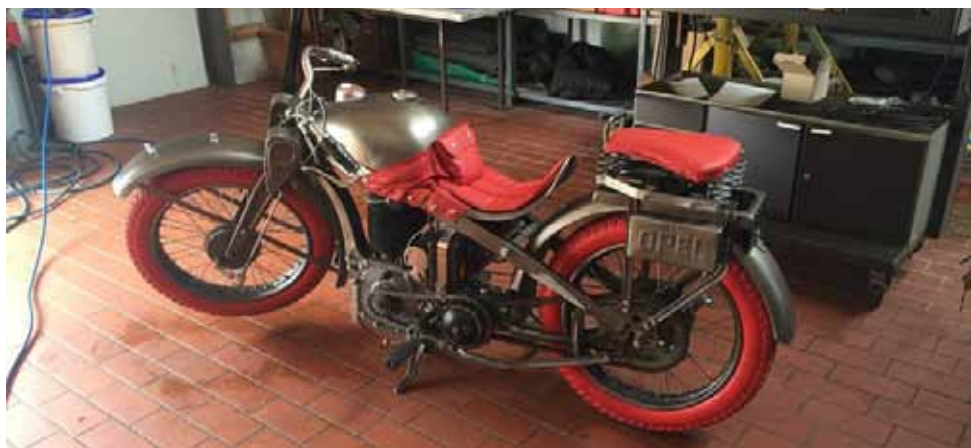
Opel baute früher unter anderem auch schöne Motorräder