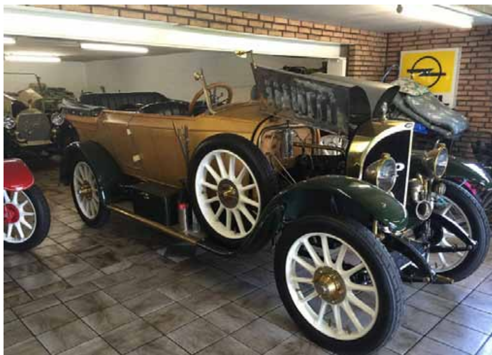
Ein schöner, alter Opel aus Holz