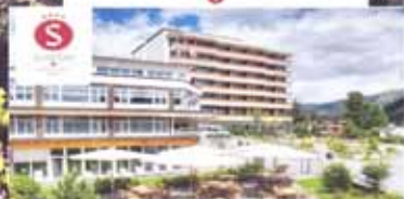
Sunstar Alpine Hotel Davos