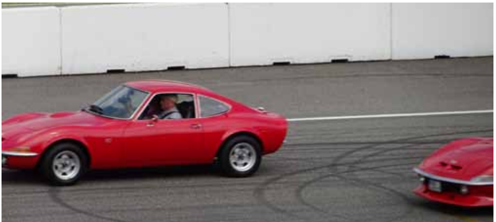
Anspannung und Adrenalin pur...