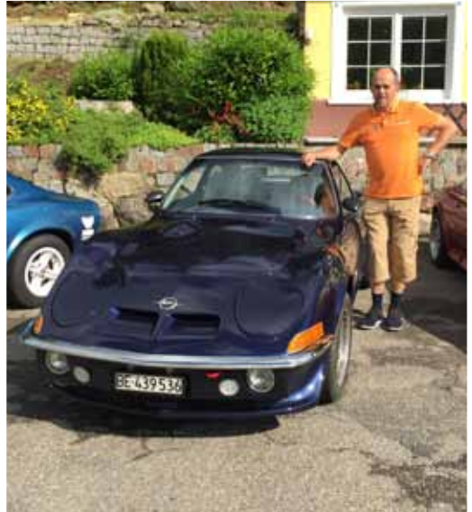
Stolz wie klein Oscar

Im Club können wir einige Neumitglieder begrüßen und auch Mitglieder, welche lange mit Abwesenheit glänzten, waren wieder einmal bei Ausflügen dabei - schön! Wenn wir mit mehreren GT's im Kolonnenverband unterwegs sind, ist es immer wieder faszinierend, den Schaulustigen die Begeisterung für unsere geliebten Autos anzusehen. Es durften unterwegs bei Ausflügen sogar Leute von anderen Kontinenten (woher die wohl alle kamen?) in den GT's Platz nehmen und sich fotografieren lassen. Wenn die viele Arbeit, die wir in unsere Autos gesteckt haben, von Fremden gelobt wird, öffnet sich das GT-Herz noch mehr und die vielen geleisteten Arbeitsstunden nach Feierabend und den Wochenenden treten etwas in Vergessenheit und in den Hintergrund. Vielen Dank an unsere Partner, die für unser Hobby so viel Verständnis zeigen. Ich wünsche mir für 2017 wiederum ein abwechslungsreiches GT-Jahr mit