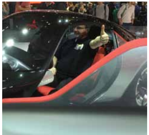
Wer sitzt denn da im neuen GT Concept?