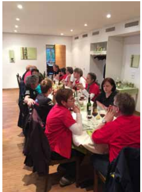
Und es wird ausgiebig diskutiert