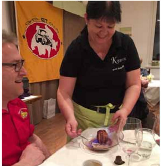
Feuer und Flamme

Ich möchte mich an dieser Stelle bei allen ganz herzlich bedanken, welche mich und meine Familie in der schwierigen Situation im letzten Jahr unterstützt haben.