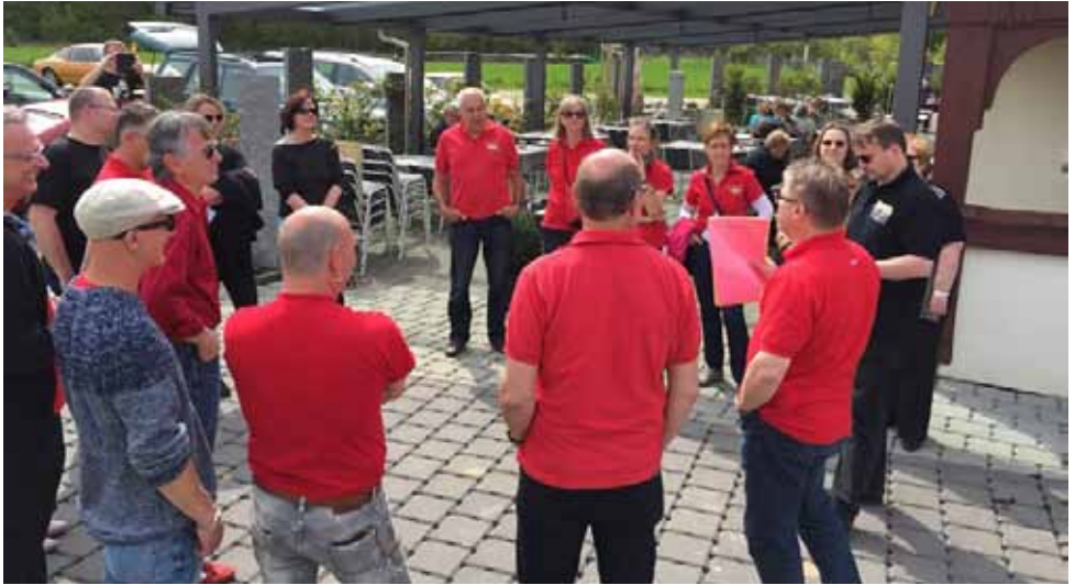
Ausfahrt anlässlich der 37. Generalversammlung der Opel GT Club Schweiz