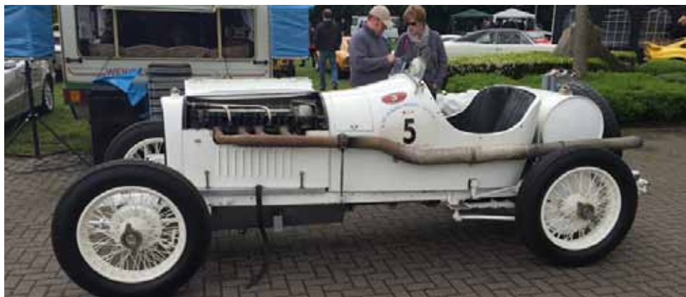
Guter alter Renner