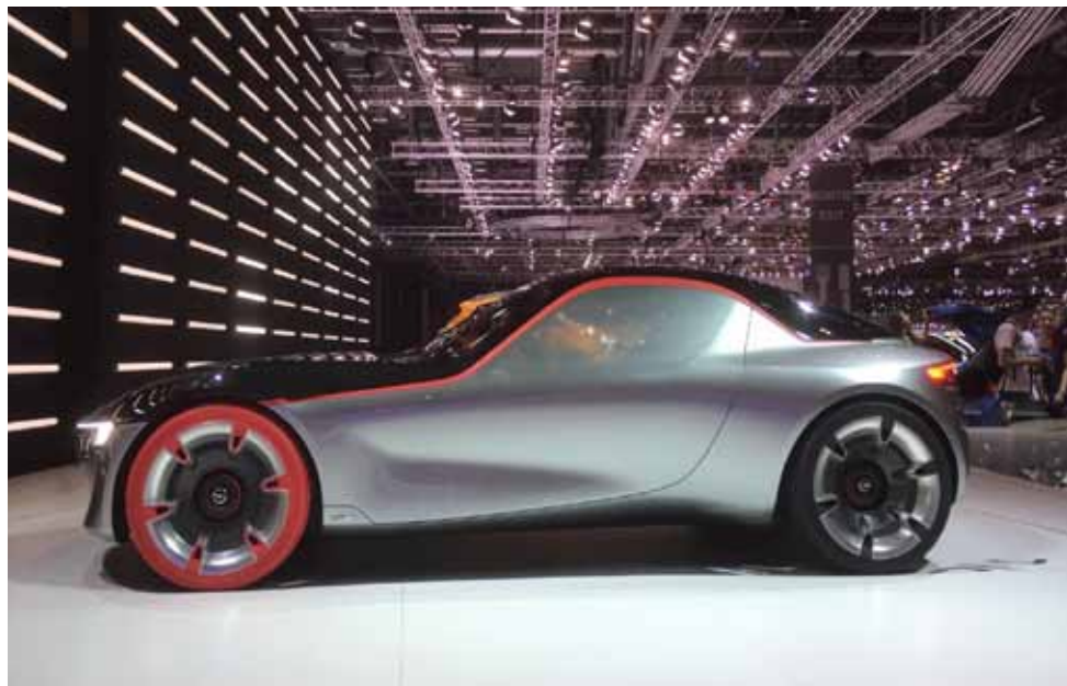
Linien aus vergangener Zeit neu aufgenommen

Der Automobil Salon Genf 2016 ist Geschichte und nun freue ich mich aufs Jahr 2018. Dann heisst es 50 JAHRE OPEL GT!