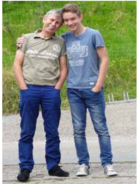
welch ein Bild Vater & Sohn

Schade fand ich nur, dass nach dem Rennen nicht alle GT'ler den Weg zurück nach Ketsch fanden und gleich in alle Himmelsrichtungen