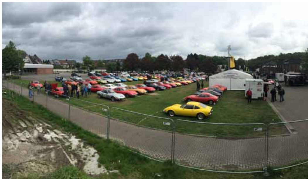
Gut gefüllter Platz mit tollen GT's