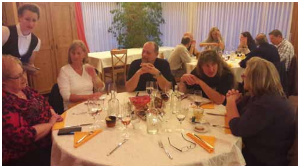
Gespanntes Warten auf das Essen