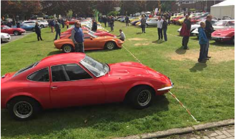
Schön, wieder einmal so viele GT's zu sehen

Gegen Abend erreichten wir das Van der Valk-Hotel in Gladbeck wo wir nach dem Einchecken auch das Abendessen einnahmen. Der Weg zu den Betten führte uns an der Bar vorbei. So mussten wir auch hier einen Halt einlegen. Am Samstagmorgen begaben wir uns ins 20 Km entfernte Bottrop-Kirchhellen. Wir fanden einen tollen Platz mit schon vielen Opel GT's besetzt vor. Ein kurzes Anstehen und schon konnten wir vom freundlichen Pförtner team unsere Tasche mit Infos und Schal empfangen. Auch eine Tasse, bedruckt als Erinnerungsgeschenk bekam jeder Teilnehmer.