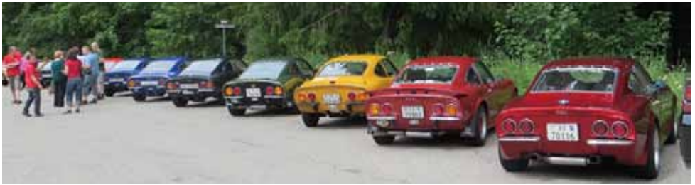
Für einmal zeigen wir den Passanten die Rückseiten der GT's

rum und an komischen Strassenschildern vorbei - aber Walter kennt die Strecke ja ...und die Schilder (er ist ja Chauffeur)! Die Strasse wird immer enger, wir haben zum Glück keinen Gegenverkehr und sind dann auch bald mitten im Zentrum an der Seestrasse und dem Ziel unseres Ausfluges. Wir haben im Restaurant „Bergsee“ Tische reserviert und wollen auch gleich dort parken, auf dem schönen grossen Parkplatz. Auf den letzten Metern werden wir von Touristen gefilmt und alle GT's werden zur Schranke (die war bei der Erkundung nicht da) gefahren. Da wir nun warten müssen, verfol-