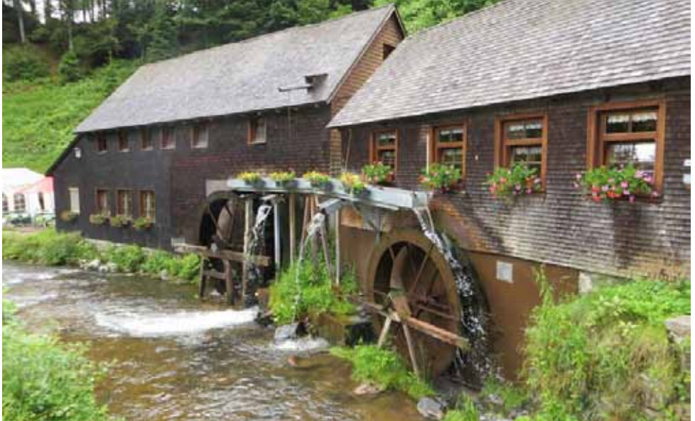
Da wird noch mit purer Wasserkraft gearbeitet