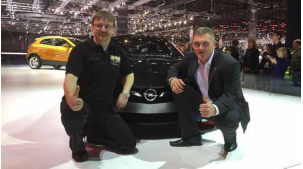
Unser Präsi mit dem GT

Nachtrag 1: Ostersonntag fand ich einen Umschlag in meinem Briefkasten von einem mir unbekanntem Absender. Der Inhalt war: ein T-Shirt des Automobil-Salon Genf, mit Opel Aufdruck, getragen von einem der jungen Studenten, welcher während den Semesterferien in der Lounge von Opel gearbeitet hat. Ein handgeschriebener Brief lag bei, der mir die Gänsehaut über den Rücken laufen liess. Er lautete: „Mit welcher Freude sie am Autosalon den GT bestaunt haben ist mir, und sicherlich auch dem Rest des Teams geblieben. Ihr Besuch war ein Highlight für mich und hat mich weiter motiviert. Ich hoffe Sie können das T-Shirt gebrauchen. Es war mir eine Freude Sie zu treffen.“