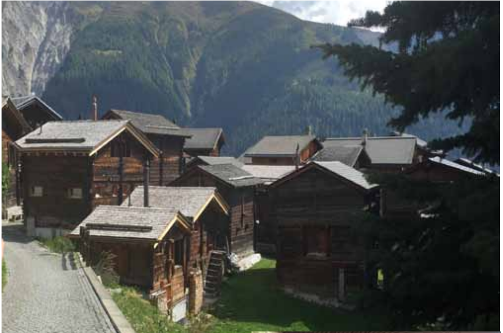
tolle alte Speicherstadt

Das herrliche Spätsommerwetter führte jedoch dazu, dass sich unser Grüppchen aufteilte. Ein paar GT-Fahrer überquerten noch weitere Pässe, andere benutzten den Bahnverlad.