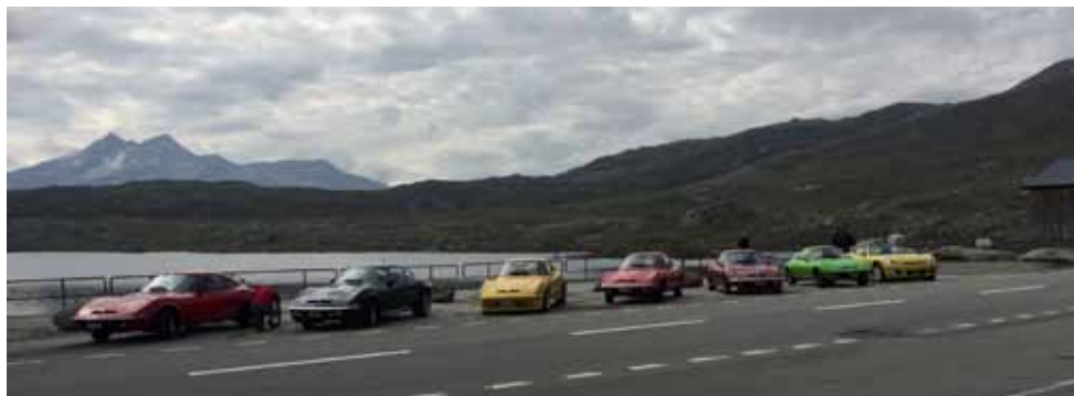
Totensee auf der Passhöhe der Grimsel bei super Wetter

wärts nach Gletsch und Bellwald, wo André für uns das Mittagessen reserviert hatte. Bei herrlichem Sonnenschein konnten wir auf der Terrasse des Hotels Bellwald ein traditionelles Walliser Gericht namens „Chouera“ geniessen. Es wurde uns erklärt, woher der Name dieses Kuchens stammt: Als um 1830 die Cholera im Wallis grassierte, versuchte man wegen der Ansteckungsgefahr das Haus so wenig wie möglich zu verlassen. Gekocht wurde mit dem, was Speicher und Garten hergaben, z.B. mit Kartoffeln, Lauch, Käse usw. Nach dem