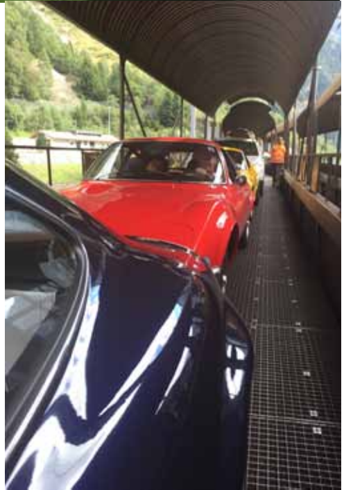
eine etwas andere Fahrt