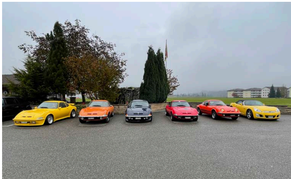
Sammelpunkt am Gründunglokal Chrump