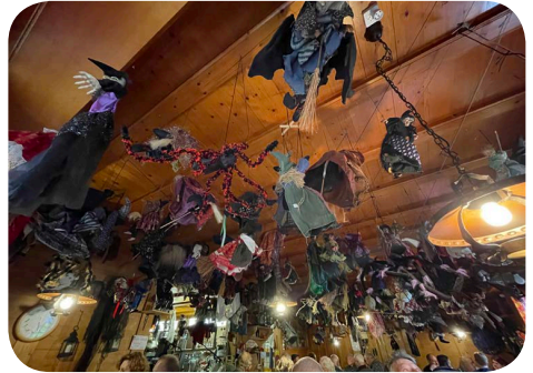
Das Häxehüsli im Emmenah

regungen, lasst es uns bitte wissen. Wir vom Vorstand versuchen alles möglich zu machen, dennoch wird es schwierig bis sogar unmöglich sein, alles so hinzubekommen, dass es allen passt. Da zählen wir auf euer Verständnis.