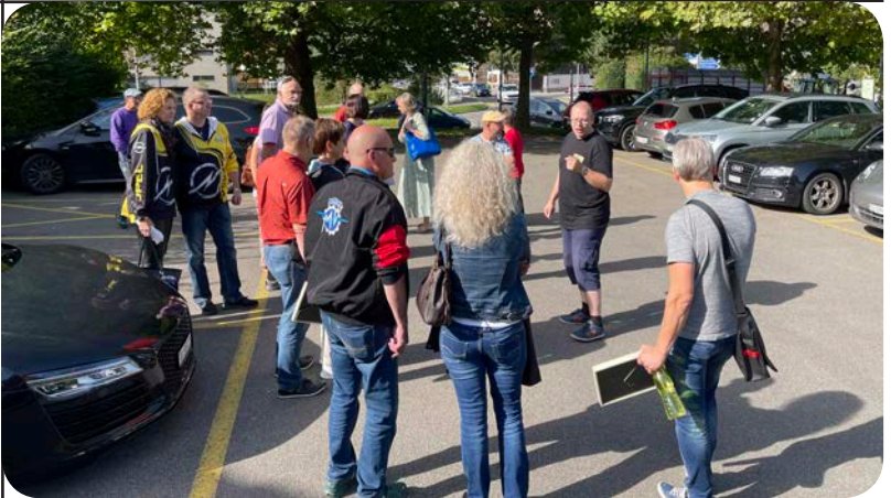
Erste Treffen 2021

Öffnungszeiten: Montags – Freitag 08.00 – 12.00 13.45 – 18.00 Samstag 08.00 – 12.00