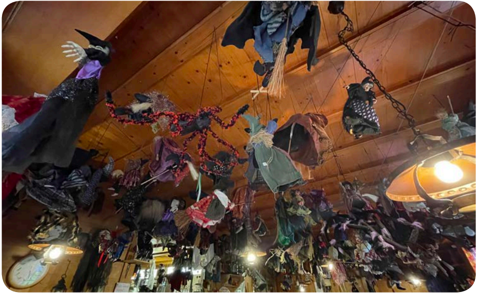
Das Hexehüsli von innen