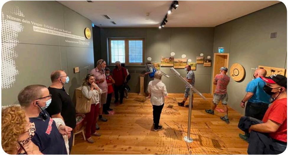
Führung mit Dugestion