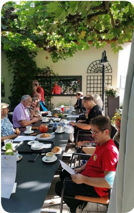
Endlich gemeinsames Essen

langer Zeit alle mal wieder zu sehen und gemeinsam ausfahren zu können und dazu noch bei strahlendem Sonnenschein unterwegs zu sein. Aber so viel Zeit muss unbedingt noch sein, ein paar Mitglieder Ehren für ihre langjährige Mitgliedschaft. Normal machen wir das ja an den GV Sitzungen, doch was war in den letzten beiden Jahren schon normal.