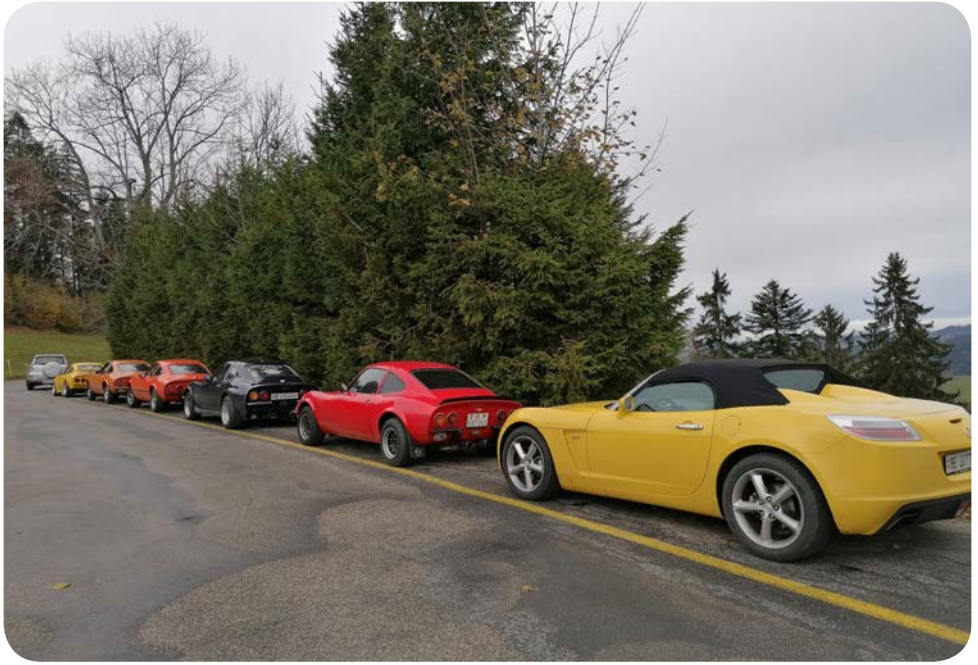
an der Lüdenalp