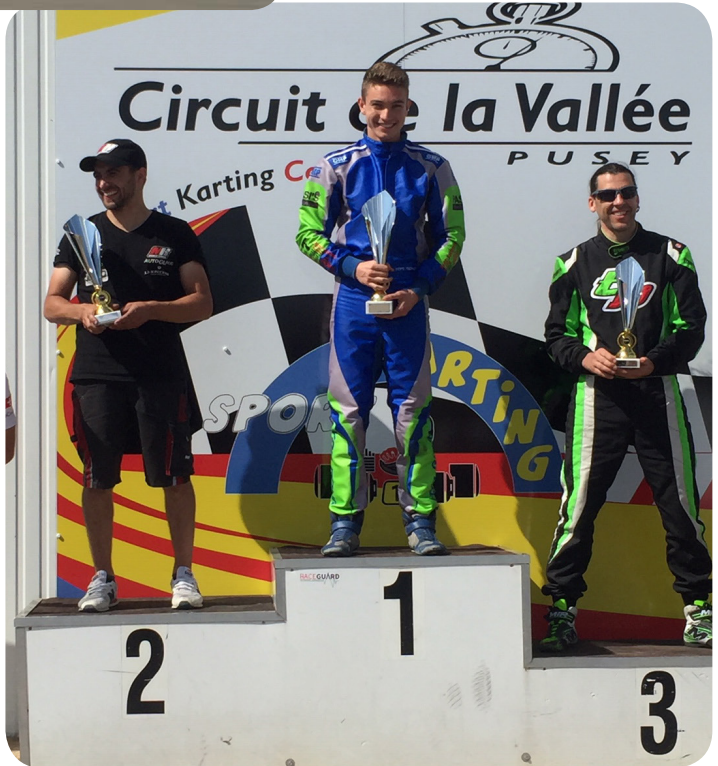
Saison 2021 Siegerehrung 1 Platz

Nichts destotrotz fuhr ich die gesamte Clubmeisterschaft mit, die ich mit großem Abstand gewann. In der Vega Trofeo konnte ich aus gesundheitlichen Gründen nicht alle Rennen fahren. Bilanz aus sechs