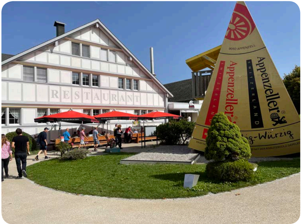
Schaukäserei des grossen geheimnisses

Nach der derzeit obligatorischen Zertifikatskontrolle ging es in die heiligen Hallen.