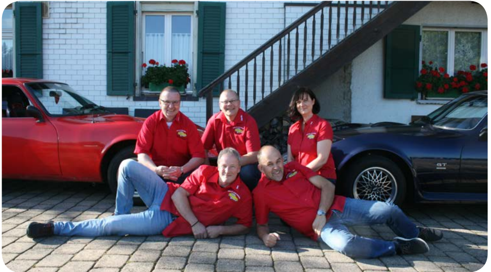
Der Vorstand 2021

staurant dann auch für uns geöffnet haben darf. Leider können wir uns noch nicht richtig treffen, das holen wir aber bestimmt dieses Jahr noch nach. Ich bin zuversichtlich, dass im 2021 wieder Treffen und Ausflüge stattfinden können. Sobald es die Lage erlaubt, werden wir euch Vorschläge zu gemeinsamen Ausflügen machen. Wir müssen jetzt halt noch Geduld haben aber das Licht am Ende des Tunnels ist sichtbar. In diesem Sinn wünsche ich euch von