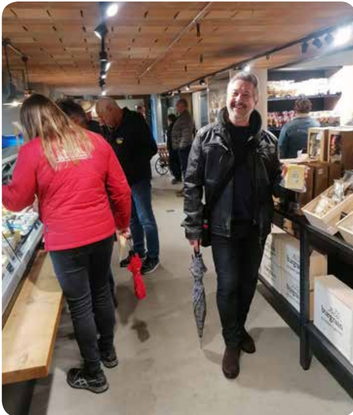
Einkauf im Hofladen

Während der Herbstausfahrt in den Jura sind dann hoffentlich mehr GTs als Kälber anzutreffen. Dafür sind dann die Tiere, sollte es warmes Wetter sein, lieber wieder im Stall.