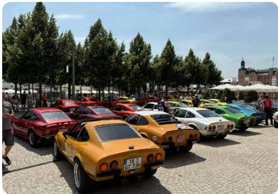
Teilehmerfahrzeuge von klassisch bis verrückt