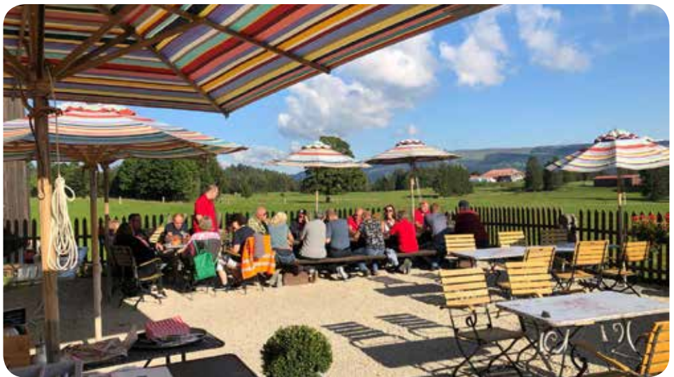
Gemütliches Beisammensein / Benzingespräche