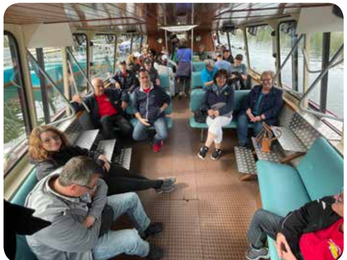
Bootsfahrt auf dem Lac de Maron

ne Strecke zum Schiffsteg bei Les Brenets, um zum bekannten Wasserfall Saut du Doubs zu fahren. Vom Parkplatz aus war es nicht weit zum Schiffsteg. Da nicht alle auf das Schiff mitkamen, musste für die Eintrittsbillette die Anzahl anwesender Personen gezählt werden. Jedoch hat uns das Zählproblem, welches