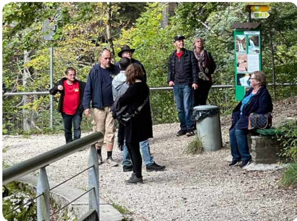
Rückweg aus dem Mooswald

wir fragten uns, wie wir wohl irgendwie halb trocken unsere GTs erreichen würden.