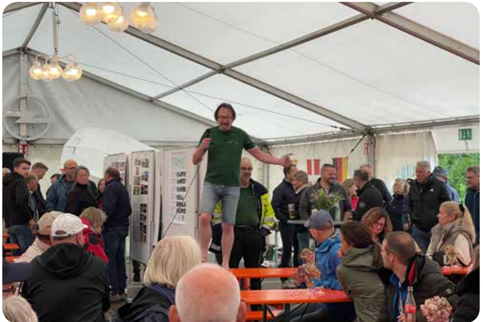
HG in seinem Element