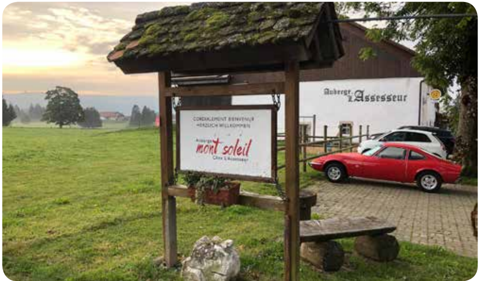
Am Hotel angekommen