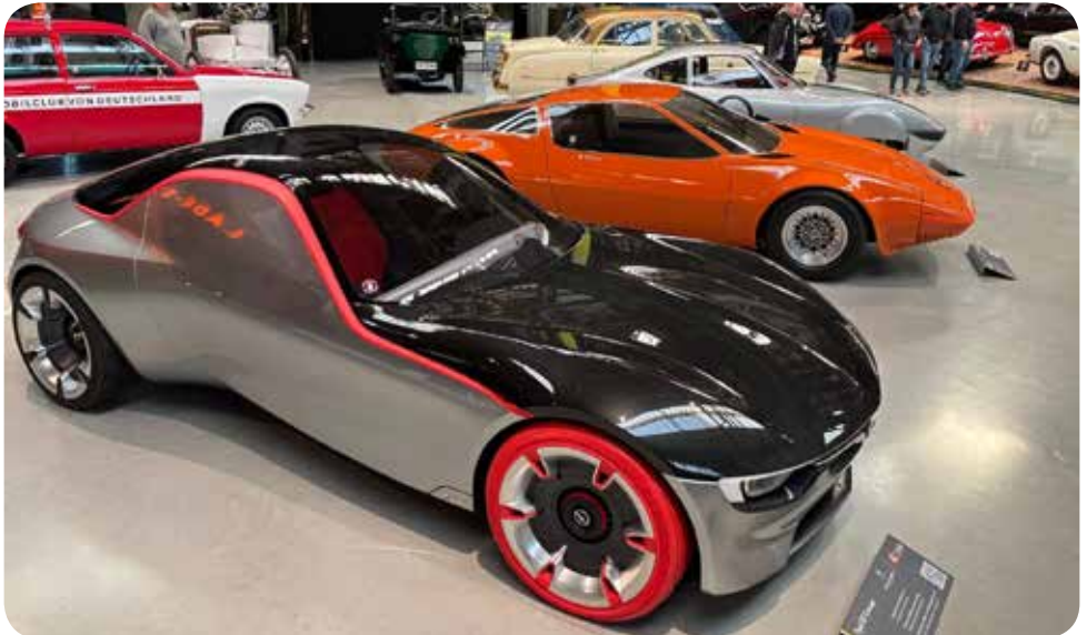
Nationales Automuseum The Loh Collection