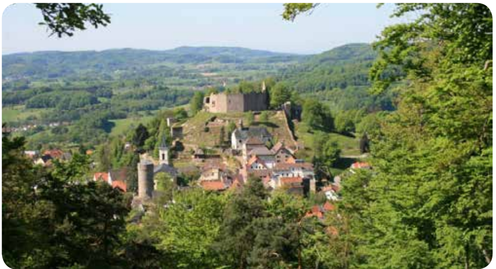
Lindenfels die Drachenstadt