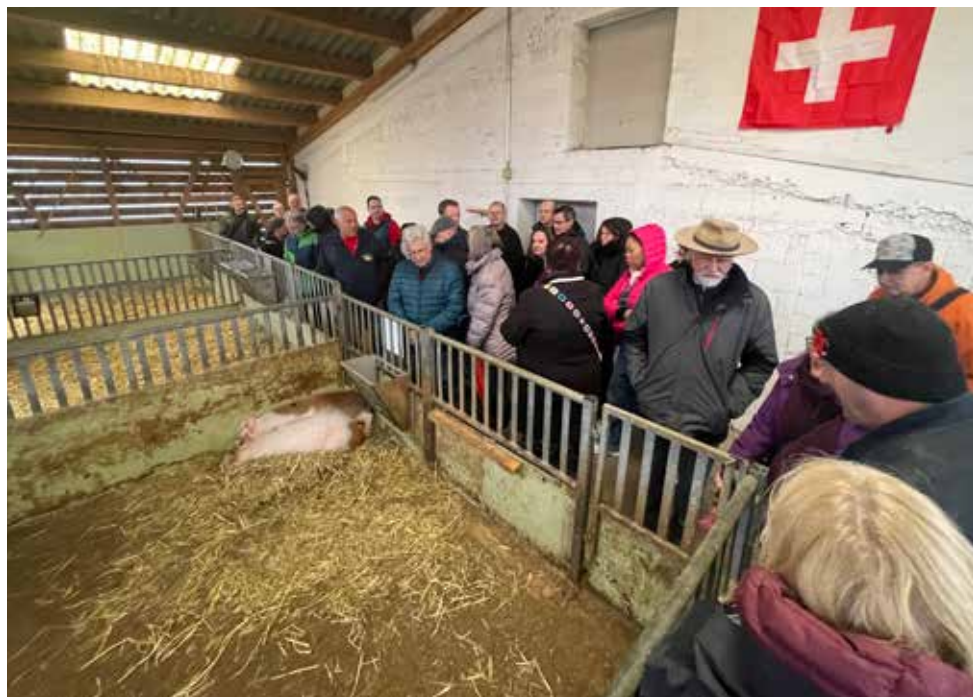
Rundgang auf dem Hof