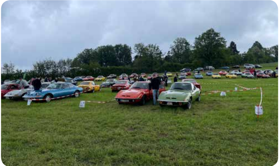
Eindrücke von Wiesen und Wettersituation

Ruckzuck war es 16.30 Uhr und die Dachverbandssitzung begann. Wir bekamen viele Informationen vom neuen Vorstand, teilweise noch für 2024 und auch schon Termine für das kommende Jahr. Danach ging es ins Festzelt zum Abendessen mit einem tollen Buffet vom Restaurant Kuralpe. Gute Gespräche und ein