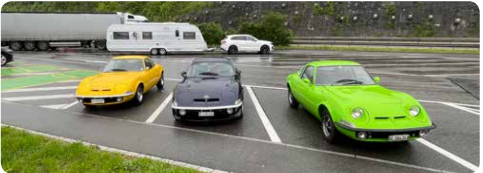
Erster Treffpunkt Parkplatz Eggberg