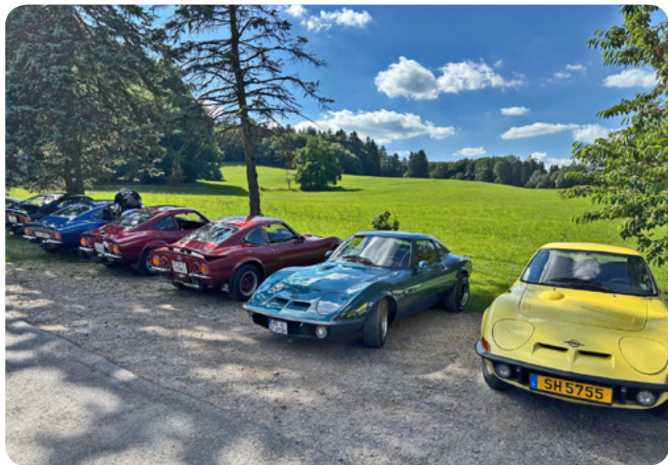
Teilnehmerfahrzeuge von klassisch bis verrückt