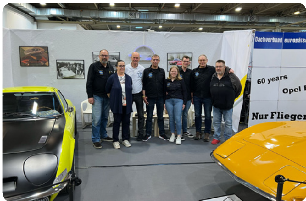
Das Team vom Dachverband auf der TCE