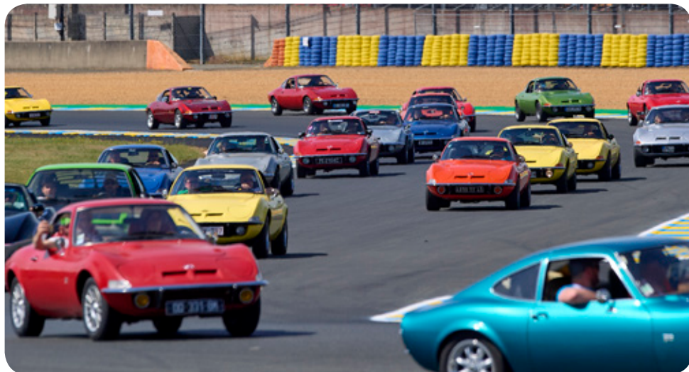
Die Rennstrecke von Le Mans