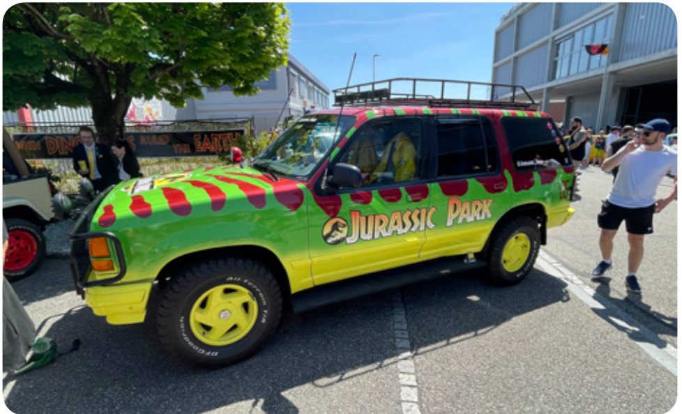
Kommen gleich die Dino's