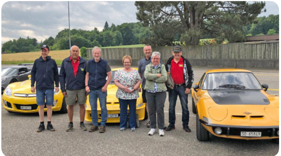
Erster Treffpunkt beim Pfingstausflug

Das Europatreffen fand dieses Mal nicht am Pfingstwochenende statt. Aus organisatorischen Gründen verschob sich das Treffen in Le Mans, Frankreich, auf den 2. und 3. Mai. Am Pfingstwochenende haben wir unsere GTs trotzdem aus den Garagen geholt, um einen Ausflug auf den Brünigpass zu machen und weiterzufahren via Interlaken zur HSR-Arena in Ramsei. Schönes Wetter und das gemütliche Beisammensein mit Köstlichkeiten