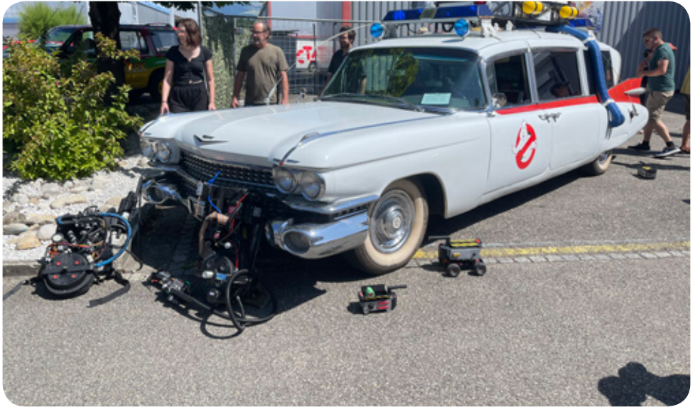
Ghostbusters im Einsatz