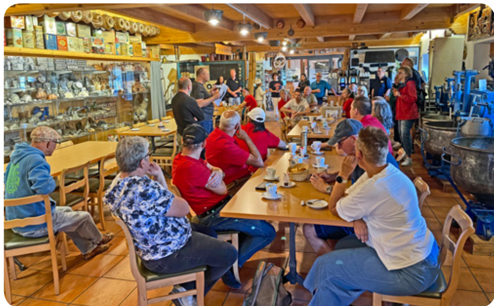
Auftackt zum Zweitagesausflug