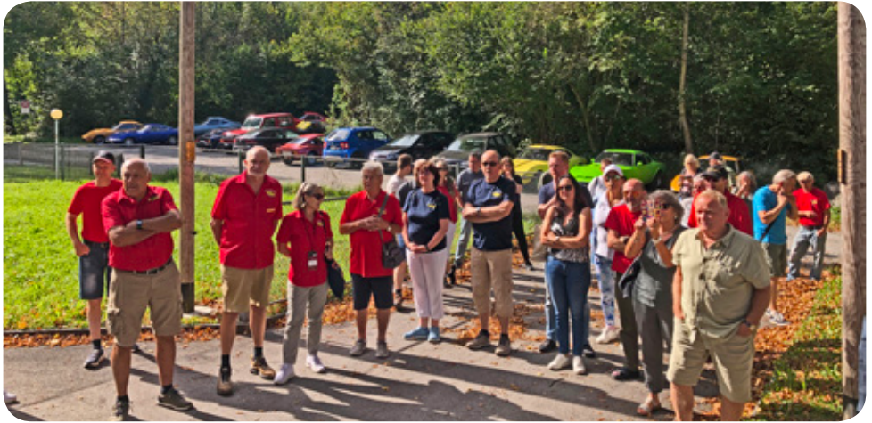
Vor dem Energiewerk

presskrüglein aufheizt und so eine Doppelfunktion als Herdplatte hat. Danach ging es weiter über den Luzisteig und somit mitten durch die Militärkaserne. Unten angekommen,