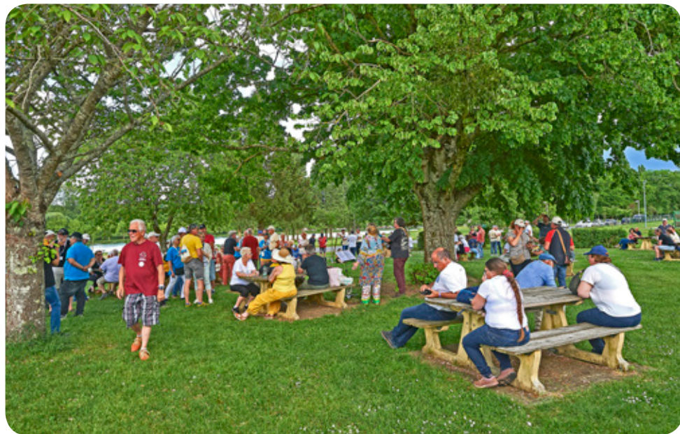
Warten auf die Rückfahrt von La Cheronne