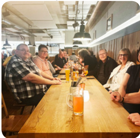
Ein Bierchen durfte nicht fehlen

Wir konnten alle Tagesordnungspunkte zügig und effizient abarbeiten, sodass die Sitzung pünktlich endete. Zum Abschluss des Tages trafen sich die Teilnehmer im MK Hotel zu einem gemeinsamen Abendessen. Es war der perfekte Abschluss in gemütlicher Runde.