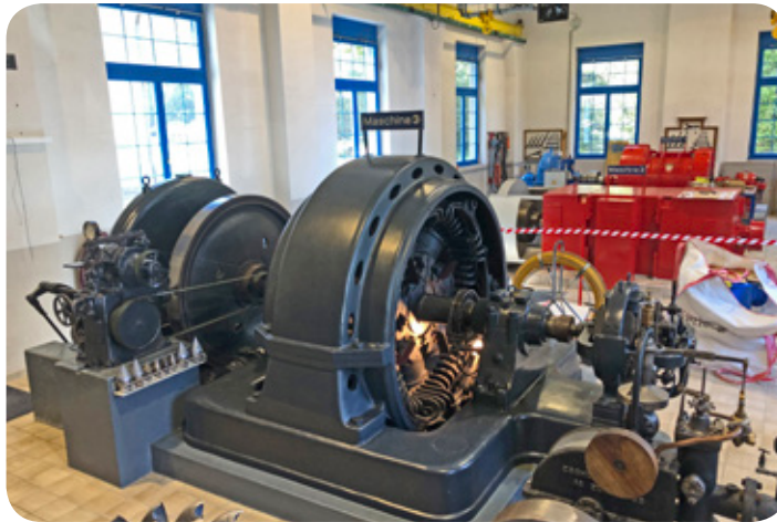
Im Vordergrund der erste Generator

auf der Strasse stehen und machten unsere Verabschiedung für einmal so. Die Option „Ernas Törkali“ ließen wir links liegen und machten uns gemütlich auf den Heimweg, damit