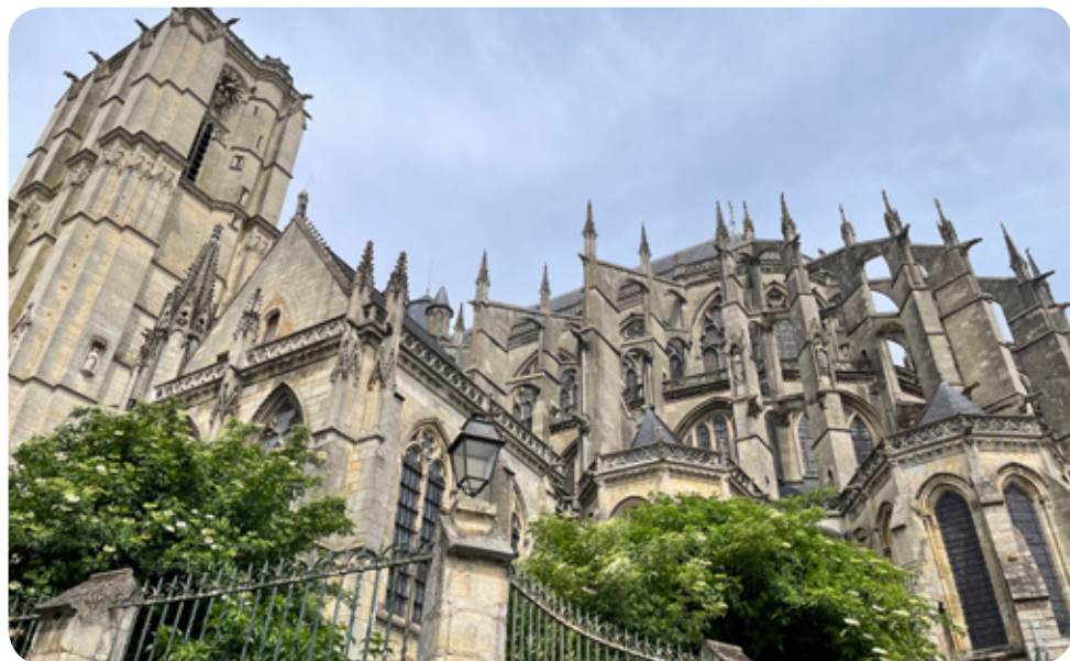
Kathedrale Le Mans