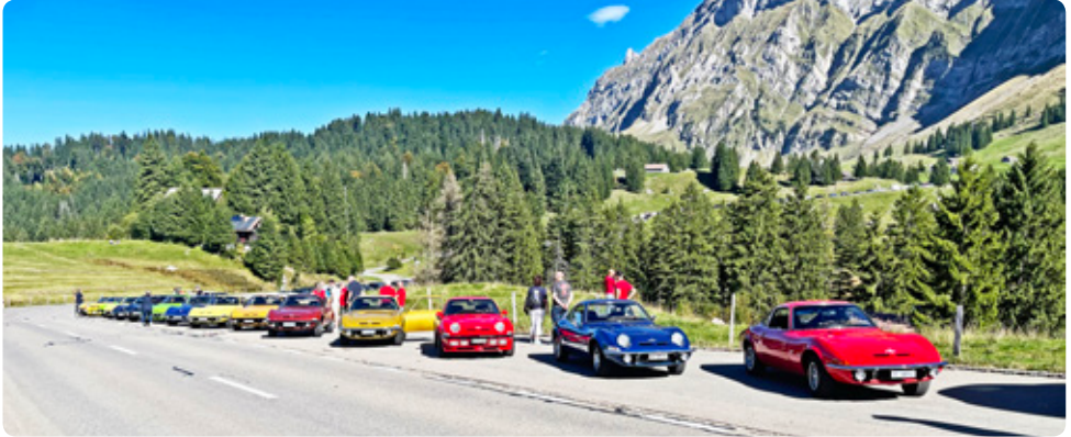
Rast vor dem Säntis

Mit großer Vorfreude fuhren wir drei am Samstagmorgen mit unseren zwei Oldies bei herrlichem Sommerwetter los Richtung Benken. Endlich konnten wir mal wieder dabei sein! In der Brezelstube fühlten wir uns wie in einem Museum, da lauter interessante alte Maschinen ringsum zu bestaunen waren. Bei Kaffee und