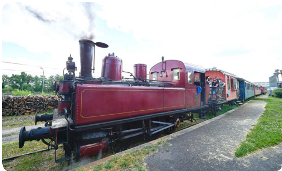
Dampflock nach La Cheronne