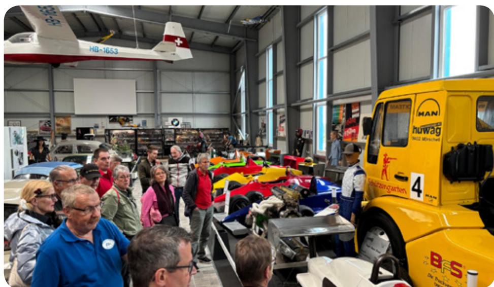
Es ist alles dabei, von klein bis gross, vom Boden bis zur Luft