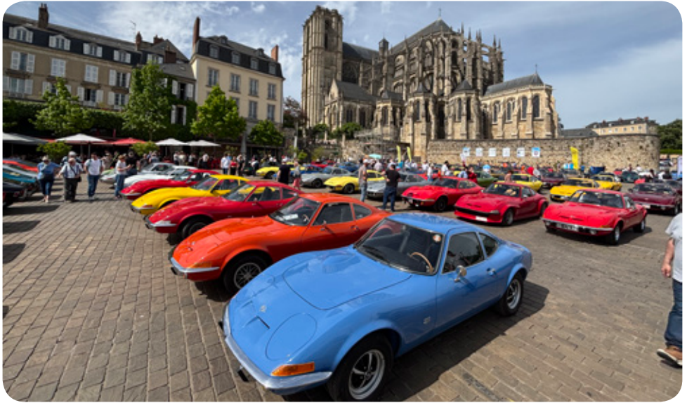
Treffpunkt Le Mans