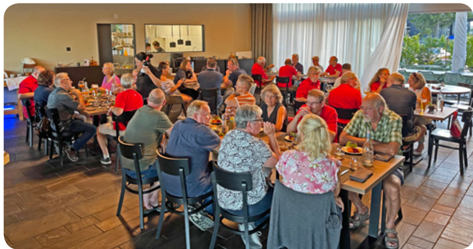
Gemütliches beisammensein und feines Essen

Gnädigerweise konnten wir aber ziemlich lange ausschlafen am Sonntagmorgen. Abfahrt war um