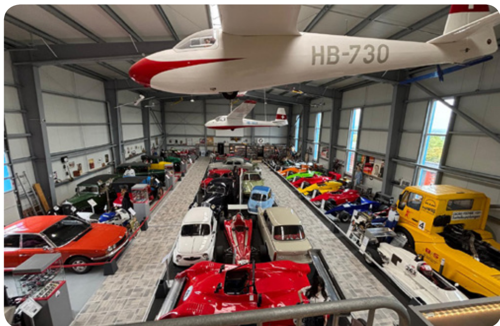
Ausblick auf die Sammlung