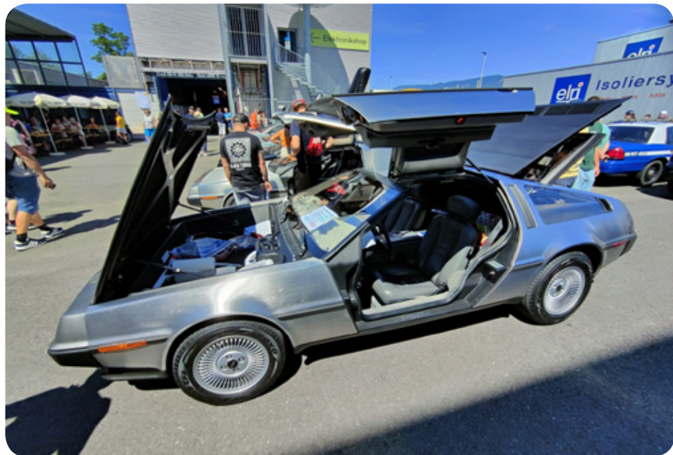
Zurück in die Zukunft

Alles in allem war die Ausfahrt zum Filmautotreffen 2025 ein rundum gelungener Tag voller Fahrspaß, schöner Eindrücke und geselliger Stunden mit unseren Clubkollegen.