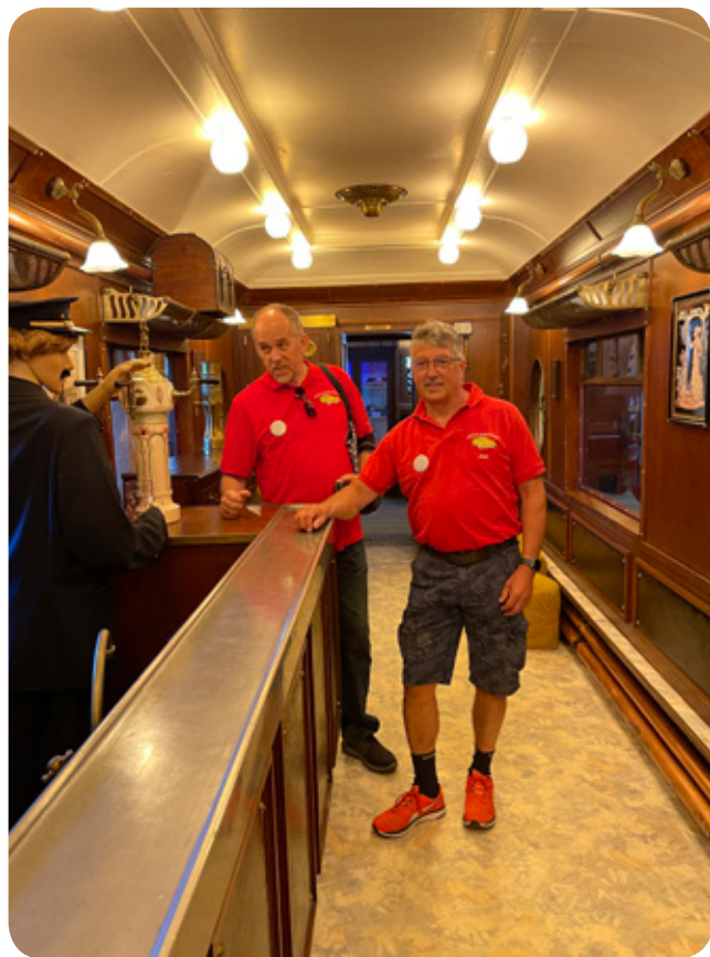
e Stange bitte

wurden bereits vor dem Treffen in Gruppen eingeteilt und je zwei Gruppen gingen gemeinsam auf eine kurze Ausfahrt zum ca. 30 km von Le Mans entfernten Musikmuseum in Dollon. Es ist so winzig, dass hier wirklich nur eine begrenzte Anzahl von Personen reinpassen. Eine sehr aufgestellte Persönlichkeit hat uns die Musikinstrumente präsentiert - es war rundum nicht nur informativ, sondern ein lustiger Besuch und sehr zu empfehlen. Schon ging es weiter zum nächsten Halt: dem Muséotrain et train touristique, in Semur-en-Vallon, ca. 5 km entfernt von Dollon. Eine Bahn brachte uns mit einer kurzen Fahrt durch den Wald an ei-