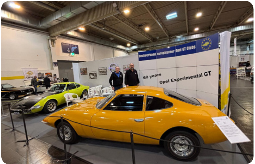
Der Experimentel GT von 1965

GT als Kultauto auch ein Markenbotschafter für den Autobauer ist.