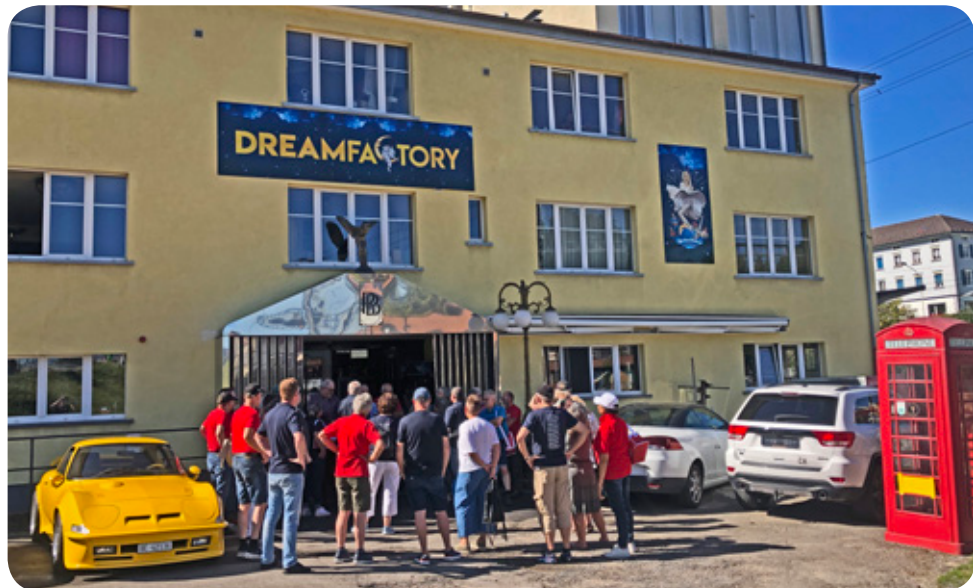
Ansprache vor der Besichtigung