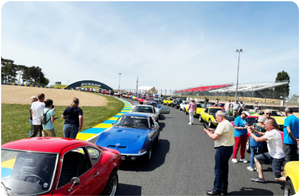
Showdown auf der Rennstrecke

konnten so die unterschiedlichsten Hotels ausprobieren. Am ersten Mai am Nachmittag trafen wir dann bei der Kathedrale von Le Mans auf dem grossen Parkplatz ein. Vor Ort waren schon viele Freunde aus der Schweiz und Deutschland, Niederlande, Dänemark, Belgien und Frankreich. Die ca. 90 GTs in allen möglichen Farben machten sich gut auf dem Marktplatz. Am Abend gab es noch ein 3 Gang-Abendessen