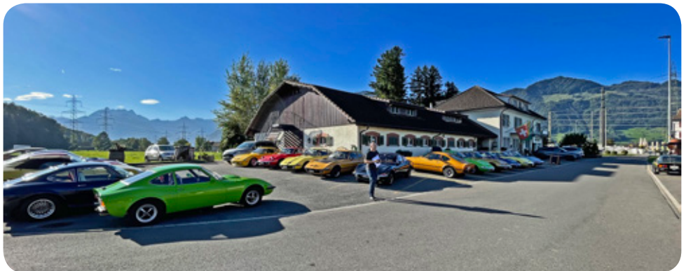
Erster Tag, bei Mega Wetter

Um 10.00 Uhr gings dann endlich los Richtung Toggenburg, über den Ricken nach Lichtensteig in den Fabrikshop der Firma Kägi, wo wir nach Herzenslust die feinen Kägi Fret degustieren und kaufen konn-