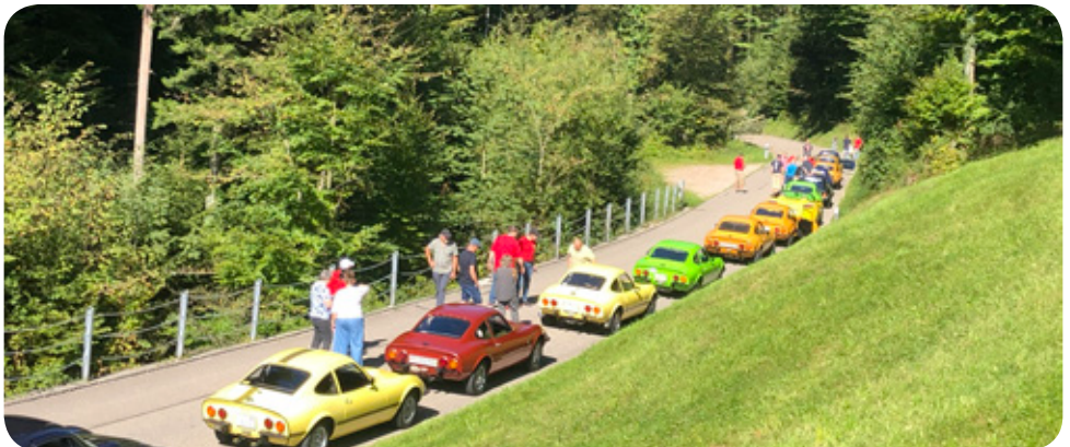
Stau vor dem Baumschlag

führte. Wir bestaunten gar manche Seltenheit aus der Film-, Zauber-, Kino- und Casinowelt, aber auch Weihnachtliches und viele Sammlerstücke und Raritäten aus allen möglichen Bereichen. Zum Schluss gab es noch eine Zwischenverpflegung, bevor es wieder weiter ging Richtung Rheintal.