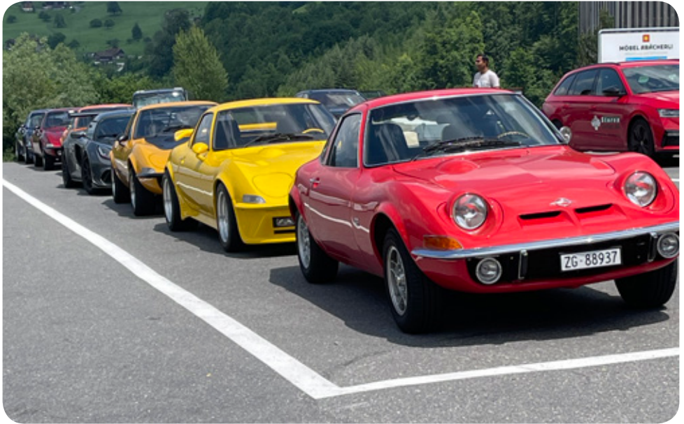
Pfingsausflug Treffpunkt OWI Land