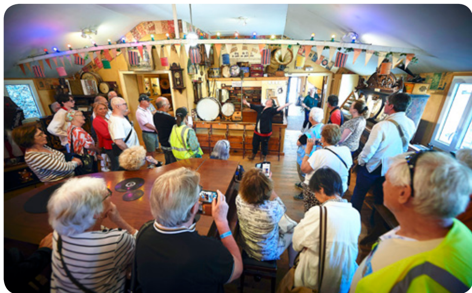
Im Musikmuseum mit aktiver Vorführung