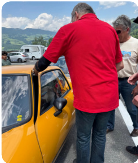
Autoknacker mit Komplize