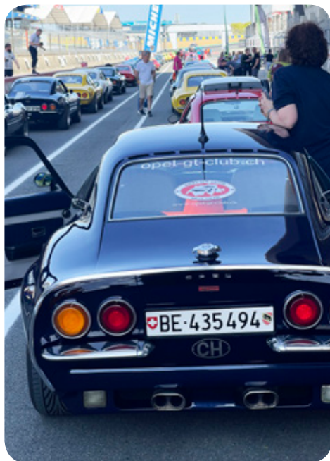
Warten vor der Rennstrecke